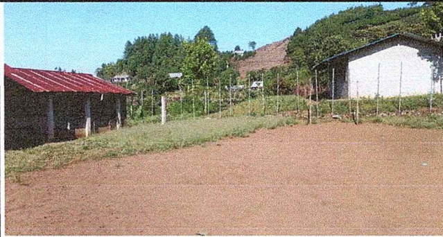
Foto 1: Vista frontal de muro perimetral que necesita ser cambiado para aislar el establecimiento de las casas vecinas.