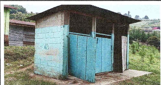
Foto 3: Sanitarios de establecimientos que necesitan ser cambiadas sus puertas para que los niños tengan privacidad al momento de utilizarlos.