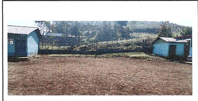
Foto 4: Otra vista de muro perimetral ya se encuentra en mal estado y que se va a dar mantenimiento y continuación.