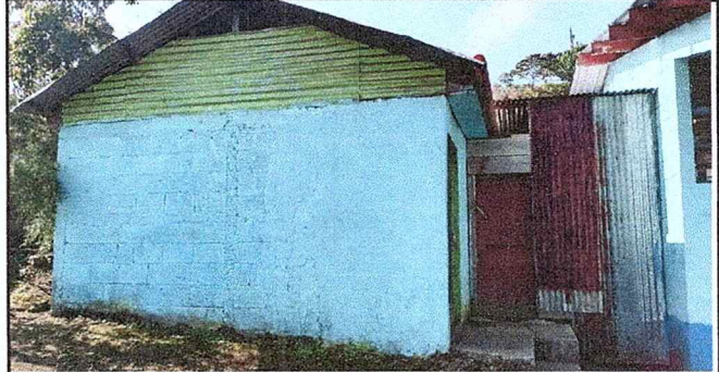
Foto 2: Vista lateral de cocina que no se encuentra finalizada en su construcción y que necesita ser remozada.