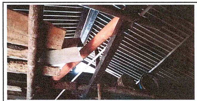
Foto 6: Vista interior del mal estado en que están la estructura en general del techo de la cocina.

Observación: Si es necesario se pueden agregar hojas adicionales y actualizar el número de hojas.